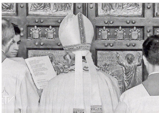
Öffnung der Heiligen Pforte im Vatikan am 8.12.2015

Keine symbolischen Hammerschläge, wie in der Vergangenheit, auch kein Mauerabbruch, bei dem 1975 Papst Paul VI. beinahe von herabfallenden Steinen getroffen wurde. Stattdessen stiess der Papst die beiden Flügel des rechten Eingangsportals zum Petersdom auf, das sonst ver-