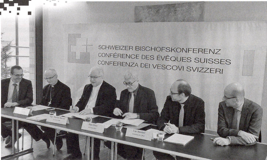
Die Spitzen von Bischofskonferenz und Zentralkonferenz informieren über die neue Vereinbarung