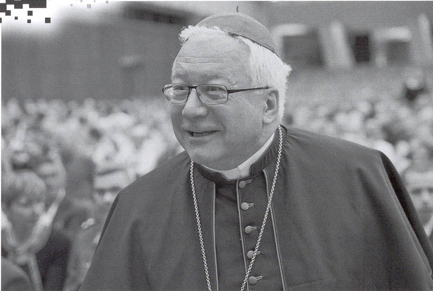
Bischof Markus Büchel, Präsident der Schweizer Bischofskonferenz.