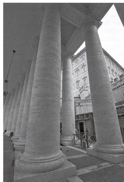
Die «Servizi» hinter den Kolonnaden und unter dem Apostolischen Palast von aussen.