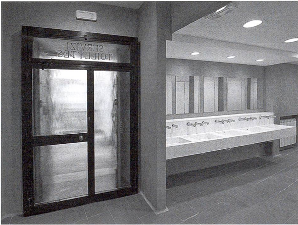
Der Eingangsbereich zu den «Servizi» im Innern (© Osservatore romano).

der keinen «ästhetischen Respekt». Im gleichen Sinn empfanden sich etliche Italiener im Web sowie durch Anrufe bei den Radiosendern über die «Verhandlung» der Kolonnaden.