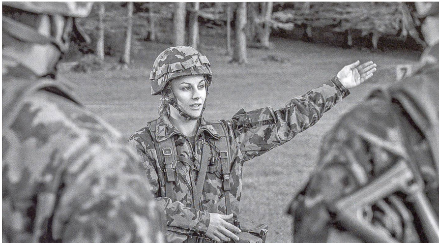
Vorgesetzte in der Schweizer Armee gibt Anweisungen.