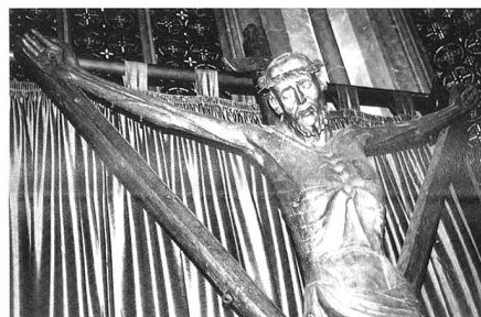
Das «Coesfelder Kreuz» ist ein sogenanntes Gabelkreuz und befindet sich in der Lambertikirche in Coesfeld/D.

Und schliesslich hatten die Römer angesichts der Häufigkeit von Hinrichtungen allen Grund, die Sache rationell über die Bühne zu bringen. Allein die senkrechten Pfosten im felsigen Untergrund zu verankern, ist nichts, was man jedes