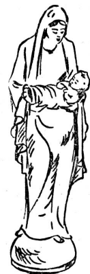
HOLZGESCHNITZTE STATUEN KRUIZIFIXE

vorm. Gebr. J. & K. Eberle gegr. 1857, Tel. 055/6 17 99