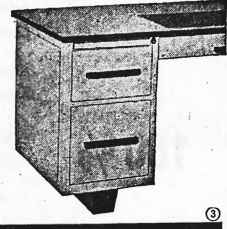
Pultsockel Typ 54 M

Verlangen Sie Prospekte und Bezugsquellennachweise