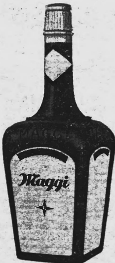
(La marque est exécutée en jaune, rouge et brun.)

Produits alimentaires et condiments, produits diététiques, pharmaceutiques chimiques pour l'industrie et les sciences et produits agricoles.