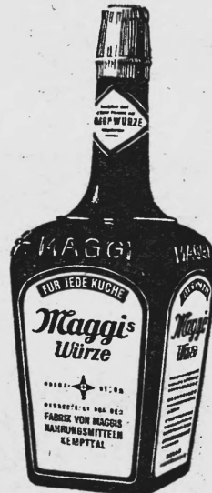
(Die Marke wird gelb, rot und braun ausgeführt.)

Nr. 104237. Hinterlegungsdatum: 8. April 1943, 17 Uhr. Gebrüder Joost, Langnau i.E. (Schweiz). — Handelsmarke. — (Erneuerung mit abgeänderter Warenangabe der Marke Nr. 53744. Die Schutzfrist aus der Erneuerung läuft vom 12. März 1943 an.)