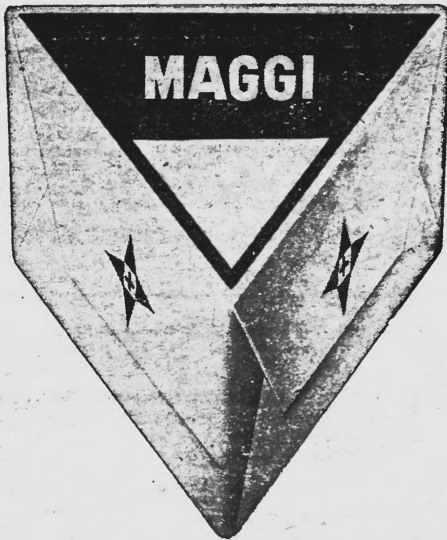
(La marque est exécutée en jaune et rouge.)

Produits alimentaires et condiments, produits diététiques, pharmaceutiques chimiques pour l'industrie et les sciences et produits agricoles.