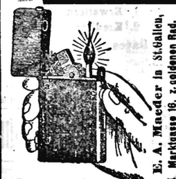
E. A. Mieder in St. Gallen, Marktgasse 16, z. goldenen Rad.

Das neueste Modell 1911 Ganz flach u. extrastark Fr. 3.50 Eile Druck u. Feuer. Prosp. gratis 1186 Wiederverkäufer gesucht 74