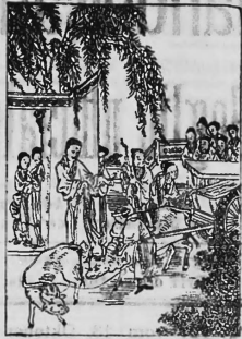
Die Jungfrau vom Spessart-Berge

Carl Breiding & Sohn, Kaufleute, Soltau (Deutschland).