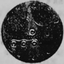
N o 63.