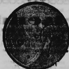
N o 202.

N o 8735. 30 mai 1902, 4 1/2 h. p. — Ouvert. — 1 modèle. — Mouvement de montre. — D. Perret fils , Neuchâtel (Suisse).