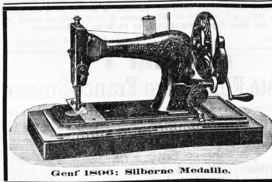
Genf 1896: Silberne Medaille.