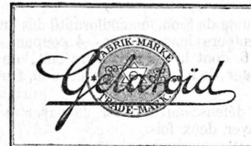
Gelatoid (Photographische Produkte).

Chemische Fabrik auf Actien (vorm. E. Schering) , Berlin (Deutschland).