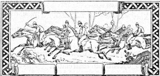
Anilinfarben, chemische und pharmazeutische Produkte.

Firma: Sandoz & Co. , Fabrikanten, Basel (Schweiz).