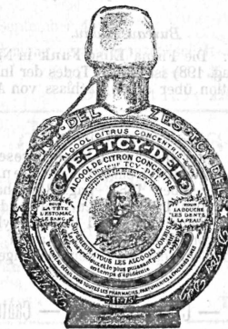
Alcool de citron concentré.