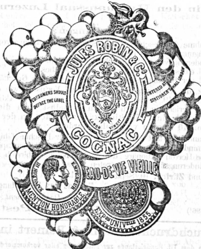
Eaux-de-vie de Cognac.

Jules Robin & C ie , négociants, Cognac (France).