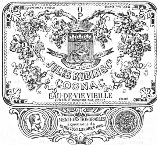
Eaux-de-vie de Cognac.

Jules Robin & C ie , négociants, Cognac (France).