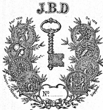
Garanti 12 Mètres.