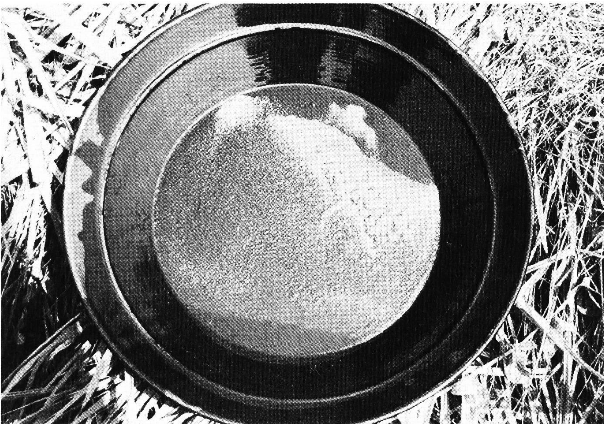
Abb. 2: Goldwaschpfanne, amerikanisches Modell, mit Waschkonzentrat.