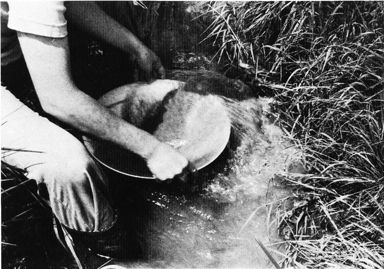
Abb. 1: Goldwaschen mit einer «Chinesenhut»-Waschpfanne