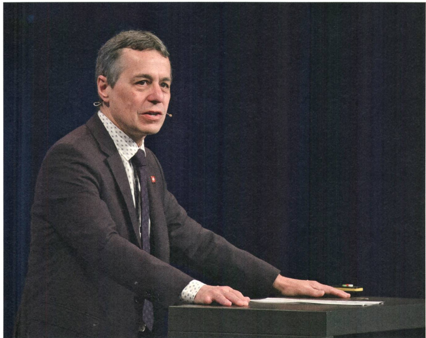
Im Einstiegsreferat ging Bundesrat Cassis auf technologische Entwicklungen ein.