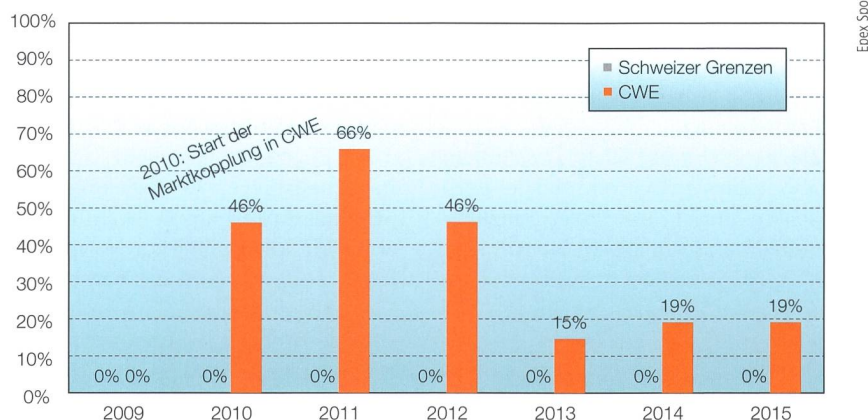
Bild 1 Entwicklung der Preiskonvergenz – der Prozentzahl der Stunden, an denen die Preise auf unterschiedlichen Märkten gleich sind seit dem Start der Marktkopplung in Zentralwesteuropa (CWE). CWE umfasst dabei Deutschland, Frankreich, Österreich und die Benelux-Staaten.

Die Mehrzahl der Länder in Europa sind heute auf diese Weise verbunden, und für den Rest laufen Vorbereitungen. Gleichzeitig wird der Stromhandel für die Marktteilnehmer selbst weiter vereinfacht, denn die vormals nationalen Bör-