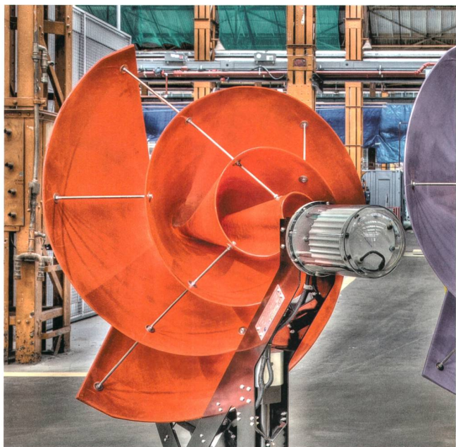
Michel van Nederveen

In den Niederlanden wird dem Thema urbane Kleinwindkraft kreativ begegnet: Die Liam F1 Turbine von The Archimedes BV soll laut Hersteller 1,5 kW bei einer Windgeschwindigkeit von 15 \text{ ms}^{-1} liefern.