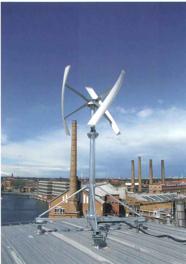
Kleinwindanlage für Tests auf dem Gelände der HTW Berlin.