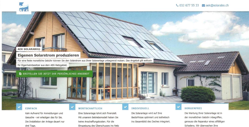
Bild 2 Als einer der ersten Energieversorger setzt AEK das Konzept des Solarleasings in der Schweiz um. Gegen eine monatliche Gebühr können die Kunden eine Solarstromanlage auf dem eigenen Dach nutzen. Der Screenshot zeigt die Website der Vertriebs-Plattform, auf der Interessenten mit einem Mausklick eine massgeschneiderte Offerte anfordern können.

Wie bereits erwähnt, haben denn auch diverse EVUs eine Solarabteilung aufgebaut oder dazugekauft. Und einige EVUs halten Solarkonzepte in der Schublade, um reagieren zu können, falls sich der Markt mit dem Eigenverbrauch schneller als erwartet entwickelt. Doch warum steigen EVUs ins Solargeschäft ein und konkurrenzieren sich gewissermassen selber? Dafür spricht, dass die Verbreitung von Solaranlagen zur Eigenversorgung kaum mehr aufgehalten werden kann. Mit anderen Worten: Angesichts des drohenden Absatzverlusts möchten sie wenigstens mit dem Verkauf der Solaranlage einmalig daran verdienen.