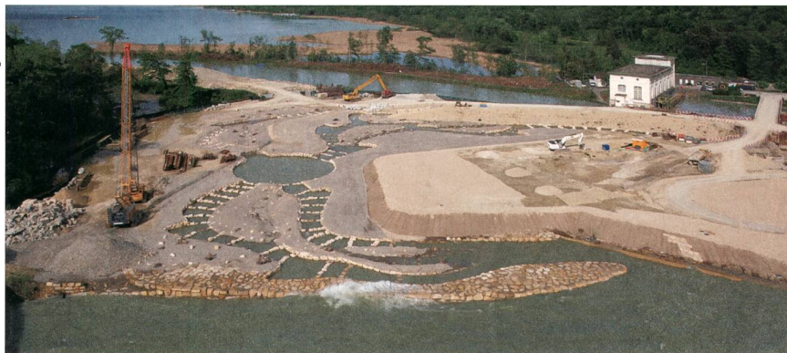
Figure 4 Une grande surface a été octroyée pour favoriser la mobilité des poissons. L'ancienne centrale se trouve à l'arrière-plan.

surtension et dispositifs de protection. Le transfert de l'énergie est assuré par des câbles au-dessus du nouveau pont vers la nouvelle sous-station de Hagneck.