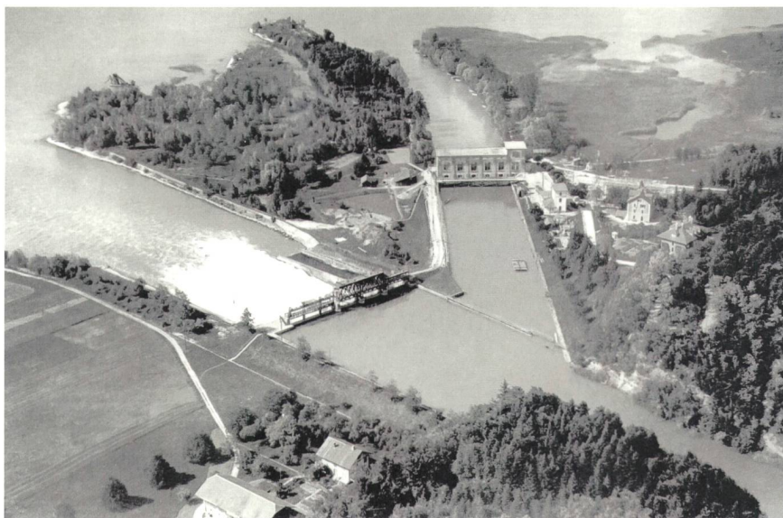
Figure 2 La centrale hydroélectrique de Hagneck aux alentours de 1920.