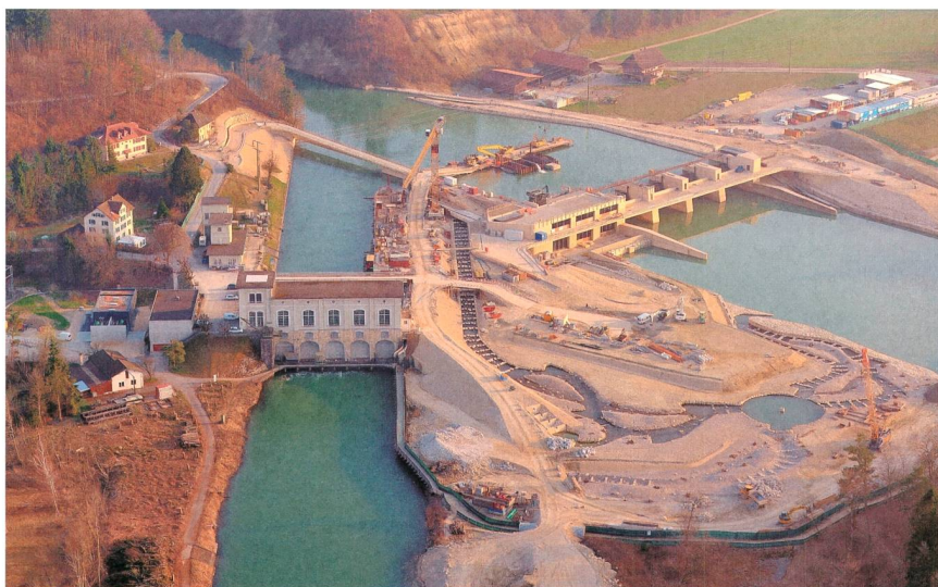
Figure 1 Construction de la nouvelle centrale hydroélectrique et de son impressionnant canal de dérivation pour les poissons (au premier plan).

La division BKW Engineering s'est chargée de la planification de la nouvelle centrale hydroélectrique. Elle compte une centaine de spécialistes et couvre les domaines de la construction hydraulique, des ouvrages en béton, des techniques de commande, de la construction hydraulique en acier (vannes, grilles, batardeaux), de l'architecture, ainsi que de l'électromécanique. Les spécialistes de BKW ont fourni les prestations suivantes :