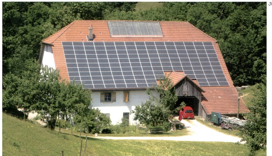
Fotovoltaik-Anlagen erhalten ab Anfang 2014 nur noch während 20 Jahren KEV-Unterstützung.

genehmigungsverfahren (VPeA) gutgeheissen. Damit können Anlagen mit einer Leistung bis zu 30kVA künftig ohne Genehmigung des Eidgenössischen Starkstrominspektorats Esti gebaut werden. Als Ausgleich für die damit wegfallende technische Kontrolle wird eine technische Abnahmekontrolle und eine periodische Kontrolle eingeführt. So können diese Anlagen rasch in Betrieb genommen werden, während gleichzeitig deren Sicherheit ohne grösseren administrativen Aufwand gewährleistet ist. Weiter setzt die Verordnung Massnahmen zur Beschleunigung der Sachplan- und Plangenehmigungsverfahren um. Die revidierte Verordnung tritt am 1. Dezember 2013 in Kraft. Se