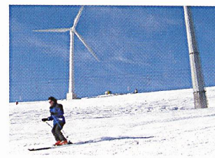
Windkraft ob Andermatt.

ideja, Postfach, 4018 Basel, E-Mail: wind@ideja.ch , Internet: www.windenergie.ch .