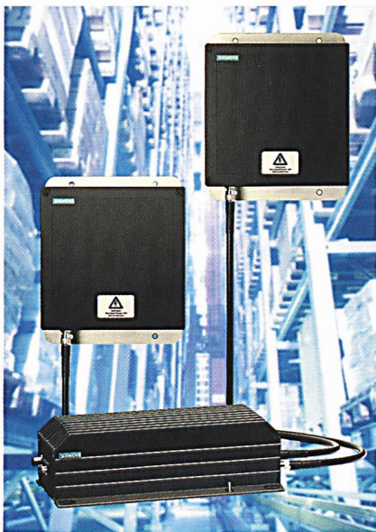
Das neue RFID-System im UHF-Bereich von Siemens Automation and Drives

Die UHF-Technik erlaubt grosse Distanzen zwischen dem Schreib-Lese-Gerät und den Datenträgern (Tags). Mit robustem Gehäuse in hoher Schutzart IP65 ausgestattet