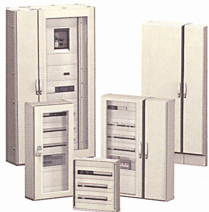
Prisma Plus, ein Schaltschrankkonzept, das massgeschneiderte Lösungen ermöglicht

Der modulare Aufbau mit vorgefertigten Bauteilen, Anschlüssen, standardisierten Abdeckungen für höchsten Berührungsschutz Bauform 4 ermöglicht eine einfache,