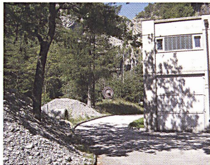
Die neue Zentrale kommuniziert über das Standardprotokoll IEC-60870-5-104

Für die 20-kV-Energieverteilung werden im Kraftwerk und in den neun Unterwerken die bestehenden Ridat-2-Fernwirkssysteme