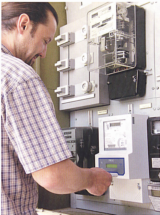
Bild 2 PMS-400 in der Praxis: Einsatz des PMS-400-Systems in der Messung eines Restaurants. Durch einfaches Stecken seiner Karte kann der Kunde jederzeit sein Restguthaben kontrollieren.

Workshop mit allen Anwendern über das gesamte Themenspektrum hinweg (Inkassoprozess und Systembedienung), stellte sich als problematisch heraus.