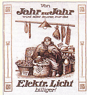
Aus den Nachrichten der Überlandzentrale Lültsfeld, 1915.

Um die Vorzüge der Elektrizität und deren Anwendung bekannt zu machen, warben die Unternehmen bereits um die Jahrhundertwende für Strom. Die Geschichte der Elektrizitätsanwendung in Deutschland und die Werbemassnahmen in dieser Zeit zeigt das neu überarbeitete und ergänzte Buch von Hanno Trurnit «Geschichte(n) hinterm Zähler».