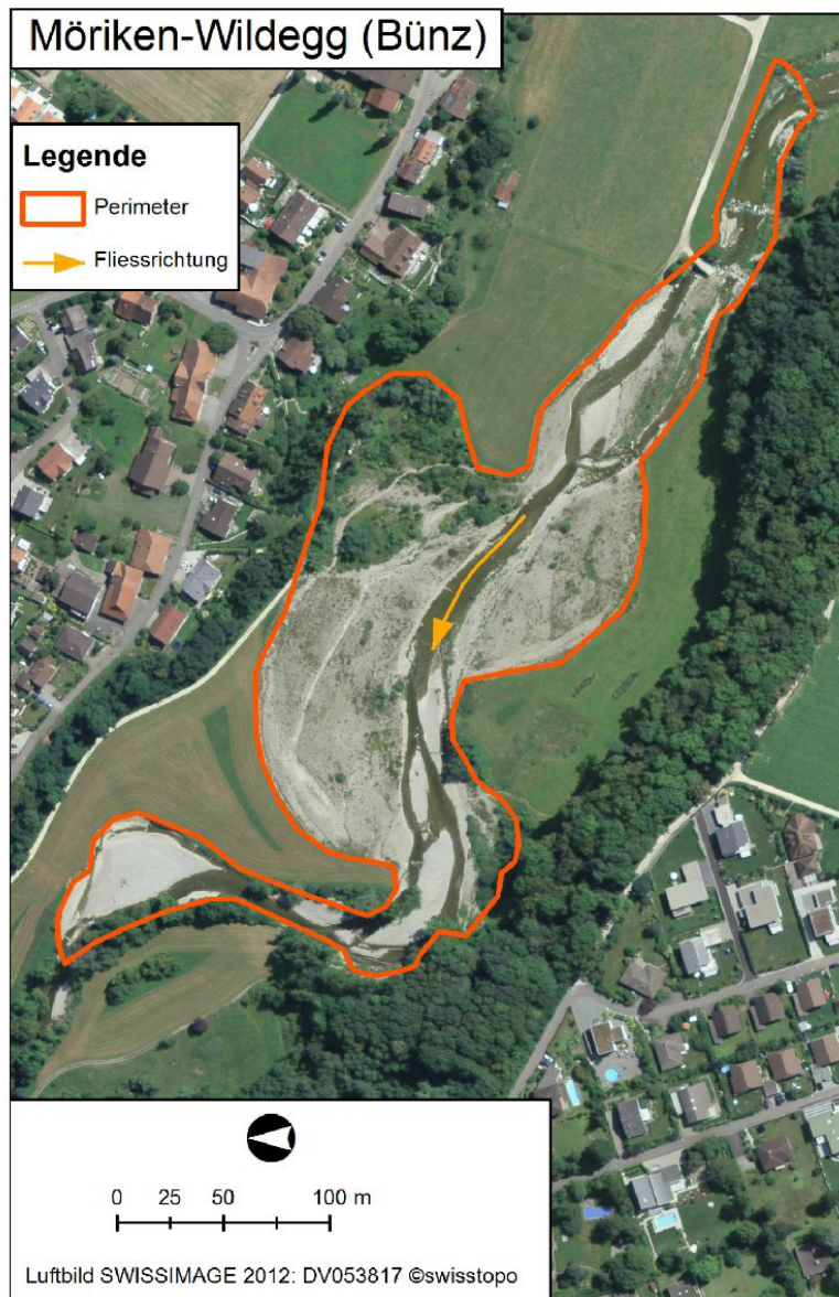
Abb. 2: Untersuchungsgebiet in Möriken-Wildegg