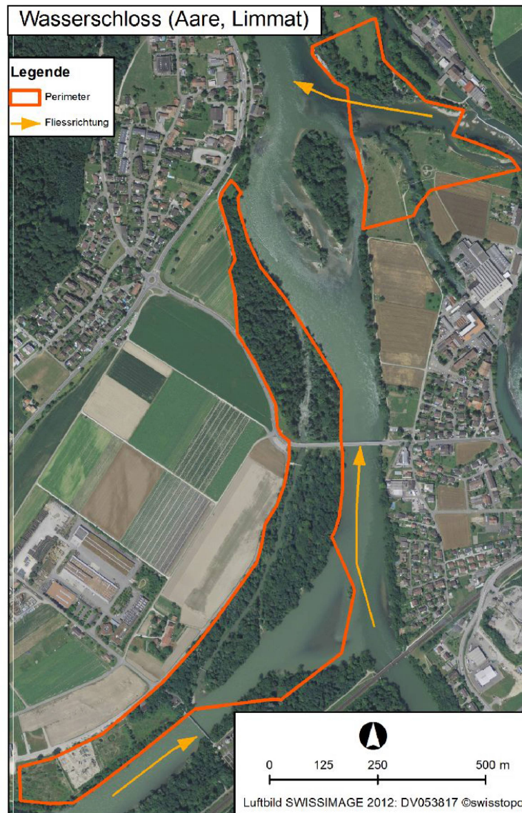
Abb. 3: Untersuchungsgebiet im Wasserschloss Brugg-Stilli.