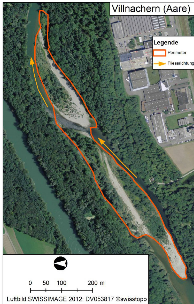
Abb. 1: Untersuchungsgebiet im Villnachern Schachen