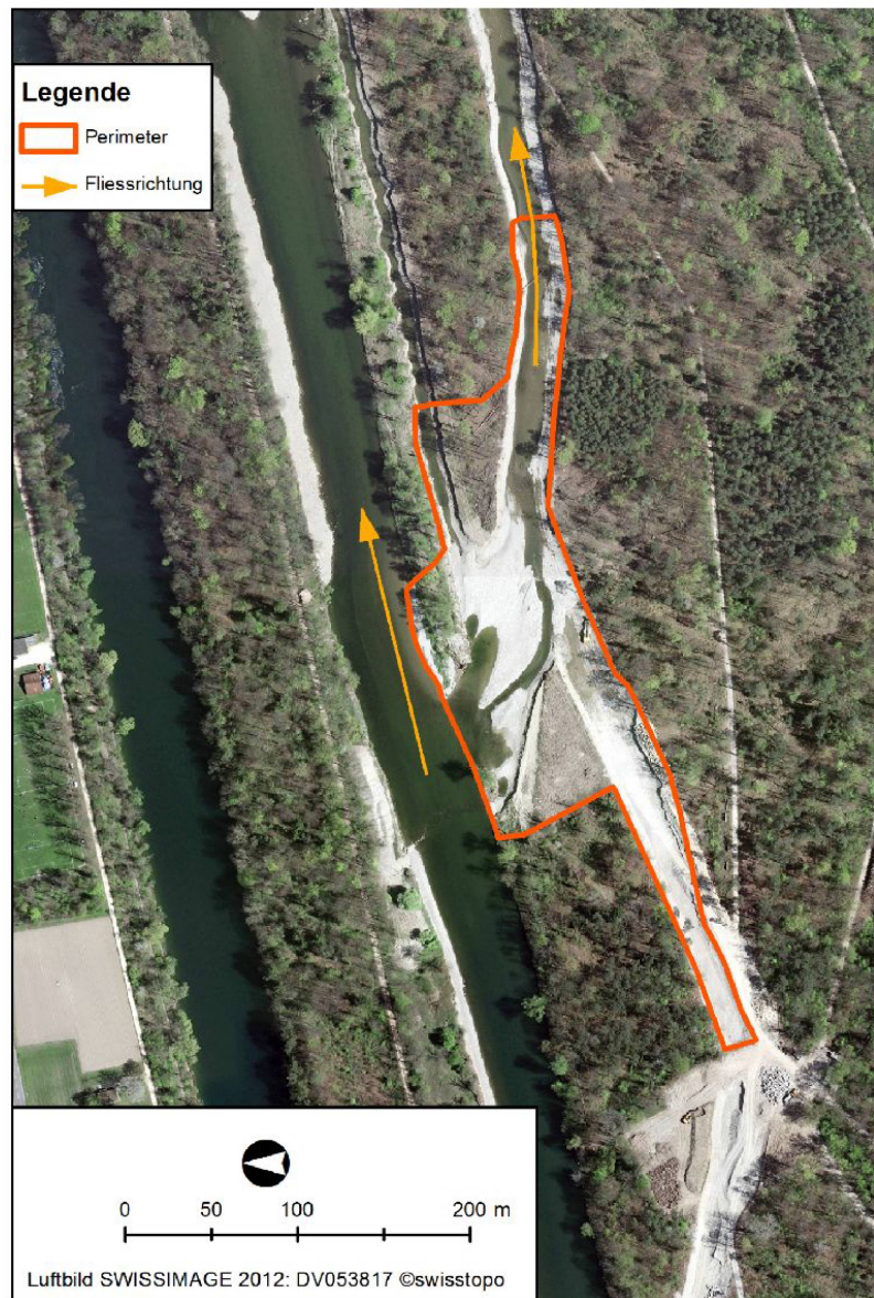
Abb. 4: Untersuchungsgebiet in Rapperswil.

Die Vielfalt der Tümpel-Ufer vom dichten Röhricht bis zur offenen Schlickfläche bilden beste Voraussetzungen für viele Laufkäferarten.