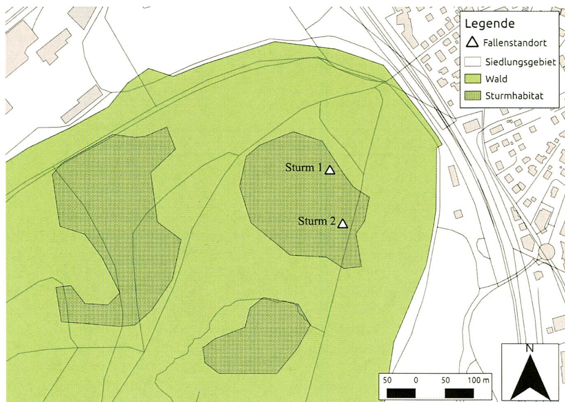
Abb. 1. Lage der Fallenstandorte «Sturm 1» und «Sturm 2» im Sturmhabitat bei Habsburg.

Das Studiengebiet bei Habsburg (Kanton Aargau, 47°28'12" N, 8°12'34" E, 430 m) (Abb. 1) war ursprünglich ein Buchen-Mischwald ( Galio odorati -Fagetum nach Keller et al. 1998), der durch die Einwirkung des Sturms weitgehend zerstört und seither weder aufgeräumt noch wieder aufgeforstet wurde. Heute, gut 12 Jahre später, wird das Gebiet von Pioniervegetation, und vor allem von Brombeeren ( Rubus fruticosus ) und Adlerfarn ( Pteridium aquilinum ) dominiert. Unsere Untersuchungsflächen waren von dichtem Wald umgeben (Abb. 1), welcher jedoch, da anders exponiert, nicht als Vergleichsfläche für die Untersuchungen benutzt werden konnte. Das zweite Studiengebiet befand sich auf dem Bruggerberg (Aargau, 47°29'43' N, 8°12'16" E, 410 m), war ebenfalls ein Buchen-Mischwald ( Galio odorati -Fagetum) und wurde nicht durch «Lothar» beeinträchtigt. Es dient als Referenzgebiet für unsere Studie. Die beiden Gebiete liegen 2.6 km auseinander und sind schwach gegen NE exponiert.