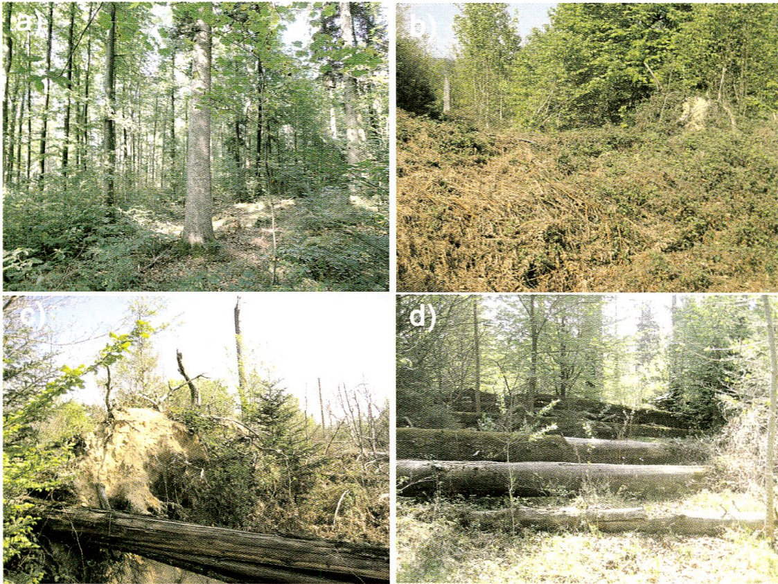
Abb. 3. — a: Eine vom Sturm Lothar unberührte Waldfläche. — b: Die braunen Überreste von Brombeere ( Rubus fruticosus ) und Adlerfarn ( Pteridium aquilinum ) dominieren im Frühling grosse Teile der Sturmflächen — c und d: Vom Sturm umgeworfene Bäume schufen Vegetationslücken. Sandige Bereiche um Wurzelstöcke sowie Überbleibsel des ursprünglichen Waldes ergaben unzählige Mikrohabitate.