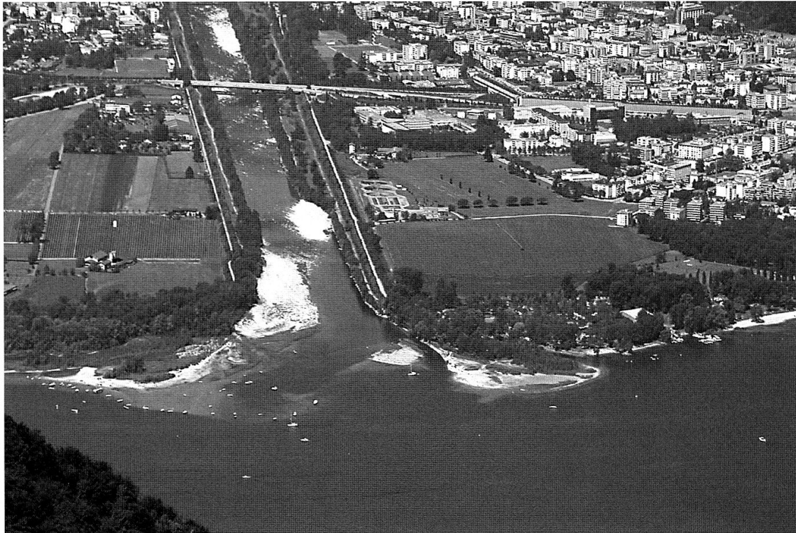
Fig. 2 – Station 1, Boscaccio (commune de Locarno). La station est localisée sur le delta de la Maggia (qui se jette dans le lac Majeur).

Une nouvelle visite le 09/09/2003, par notre collègue Nicola Patocchi, a permis de confirmer la présence d'une femelle (probablement la même) d' A. patruelis , en compagnie d'un individu de Locusta migratoria .