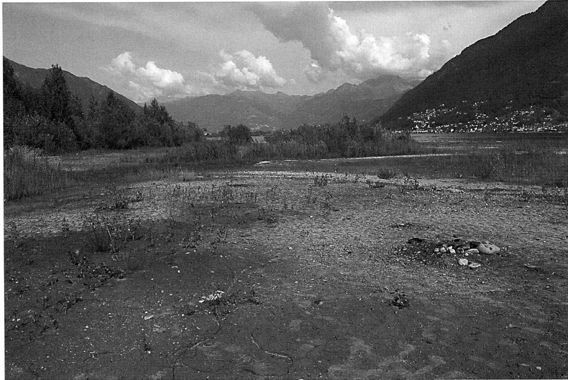
Fig. 3 – Le milieu occupé est une rive d'alluvions assez grossières, partiellement colmatées, colonisées par une végétation pionnière.

Par ailleurs, des recherches supplémentaires dans un périmètre proche de la zone de la découverte n'ont permis d'ajouter que 3 nouvelles espèces: Nemobius sylvestris , Gryllus campestris et Conocephalus fuscus .