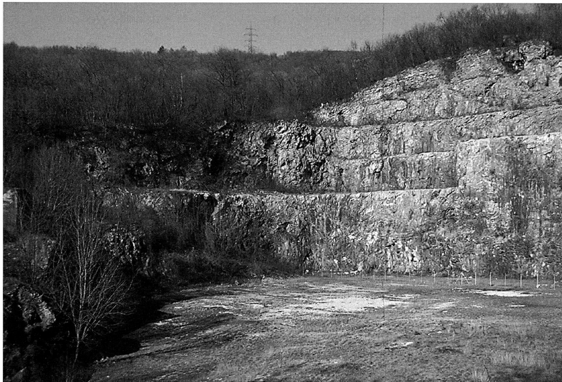
Fig. 4 – Station 3, Arzo. Carrière de calcaire abandonnée. Les individus d' Acrotylus patruelis se trouvaient sur les parties dénudées.

Dans le Tab. 1, nous avons également indiqué les espèces présentes dans les milieux en contact avec les stations à A. patruelis . Ces listes ne sont certainement pas exhaustives, mais l'effort de chasse est comparable entre les trois stations. Plusieurs espèces témoignent du caractère très pionniers des habitats fréquentés par A. patruelis : Eumodicogryllus bordigalensis , Pteronemobius lineolatus , Aiolopus strepens , Sphingonotus caeruleans et Oedipoda caeruleans .