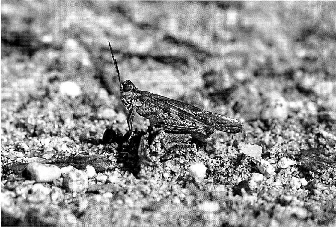
Fig. 1 – Mâle d' Acrotylus patruelis , Locarno (TI), le 05/08/2004.