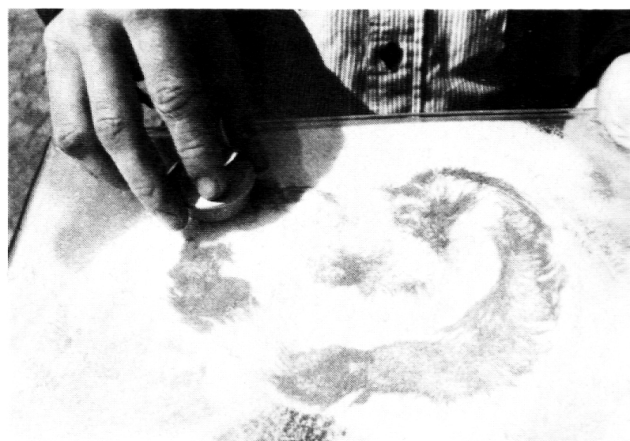
Küchelhaus-Objekte: Spiel mit Sand, Eisenfeilspänen und Magnet

Spielende Lehrkräfte sind hier wohl die tüchtigsten Anwälte «ihrer» Schüler. Sie können an Spielnachmittagen, in Turn- und «gewöhnlichen» Schulstunden, in Vereinen und an Elternabenden Impulse vermitteln und andere mit dem Spielvirus infizieren. Spielfreude ist gefährlich ansteckend. An einem Spielabend beginnen Väter zu lachen, die sonst noch kaum eine Miene verzogen haben. Mütter verwandeln sich in Krokodile im Sumpf oder Ratatouille und vergessen für unbeschwerte Momente ihre Angst vor einander. Erinnerungen tauchen