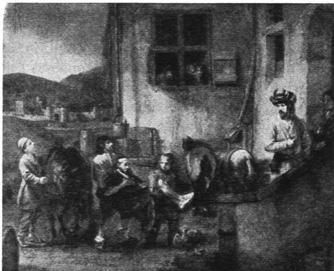
Rembrandt: Der barmherzige Samariter

Mut braucht der Katechet unbedingt eine gewisse Vertrautheit mit den Vorgängen, die sich auf dem Gebiet der Kunst abgespielt haben und abspielen.