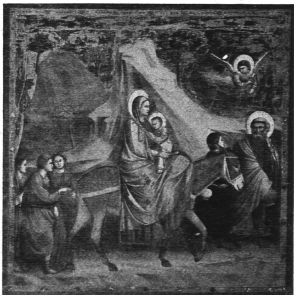
Giotto: Flucht nach Ägypten

Ein anderer Einwand gegen die Verwendung von Bildern im Bibelunterricht lautet etwa so: Das gezeigte Bild zerstört (oder verhindert) eine eigene innere Vorstellung der Schüler. — Sicher kommt es hier ganz auf die Art und Weise an, wie das Bild in Beziehung zum Text gebracht wird, der vermittelt werden soll. Irgend eine «innere Vorstellung» im Schüler ist nicht an sich schon wertvoll. Die innere Vorstellungskraft will auch erlernt und geschult sein. Der «innere Nachvollzug» einer wertvollen künstlerischen Interpretation ist ein Mittel — wenn auch nicht das einzige — zur Entwicklung der eigenen Vorstellungsfähigkeit. — Es gibt noch genug Gelegenheiten, bei denen der Schüler dann ganz auf