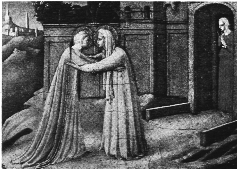
Fra Angelico: Maria besucht Elisabeth

Die Bezugsbedingungen sind ähnlich wie die des profanen Schulwandbilderwerkes. Zu jedem Bibelwandbilderwerk erscheint ein Kommentar. Das Sekretariat des KLVS, Postfach 70, 6301 Zug, läßt sich gerne durch eine große Zahl von spontanen Abonnementsbestellungen und Nachlieferungsaufträgen überraschen!