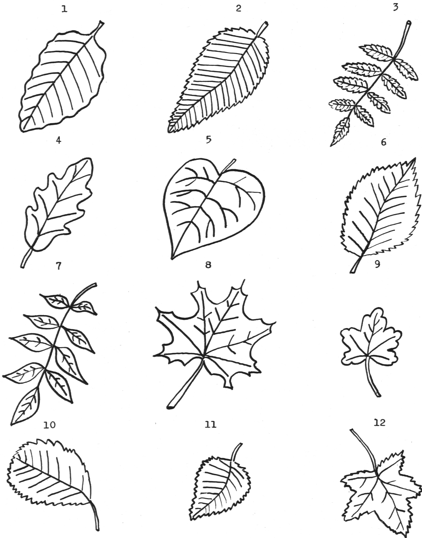
Tafel der bekanntesten Laubbaumblätter: