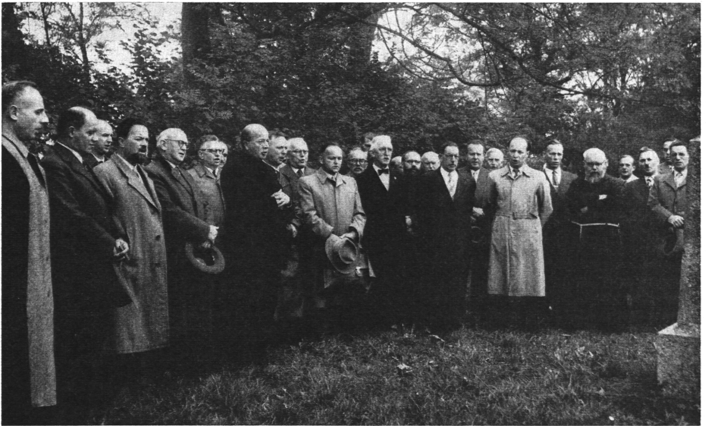
Auf der Ufenau – «Trittst im Morgenrot daher»

und schenkten Rapperswiler Firmen von ihren feinen Produkten, besonders die Nussa.