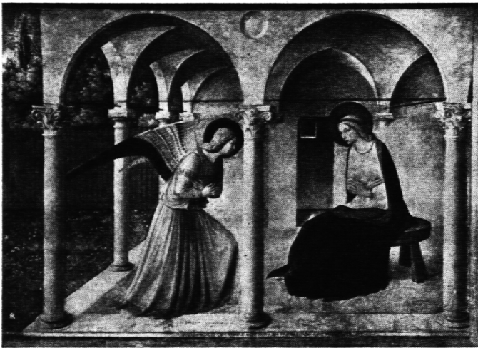
Fra Angelico, 1387–1455, Verkündigung, Florenz