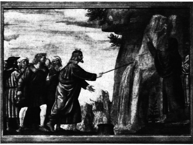
Bernardino Luini, 1475–1532, Moses schlägt Wasser aus dem Felsen, Mailand