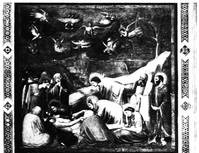
Giotto, Grablegung, um 1305, Padua