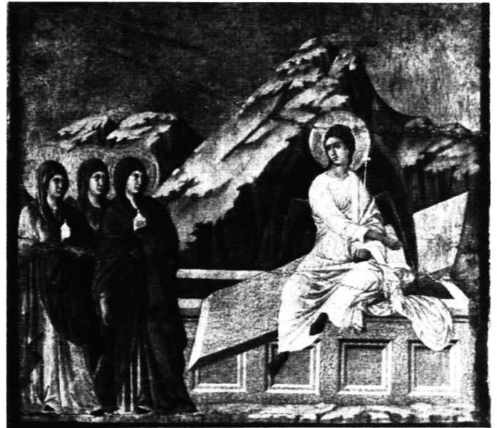
Duccio di Buoninsegna, 1260–1319, die drei Frauen am Grabe, Siena

Andere suchten sich Bergführer aus. Da gab es einen erfahrenen Bergführer, der aber ziemlich viel verlangte. Er seilte die Touristen an und führte sie dank seiner großen Erfahrung einen sicheren Weg. Doch verlangte er von seiner Seilschaft einen guten Gehorsam im Befolgen seiner Ratschläge, die er immer wieder gab. Abwechselnd ließ er Stufen schlagen, von Zeit zu Zeit erklärte er die Route auf