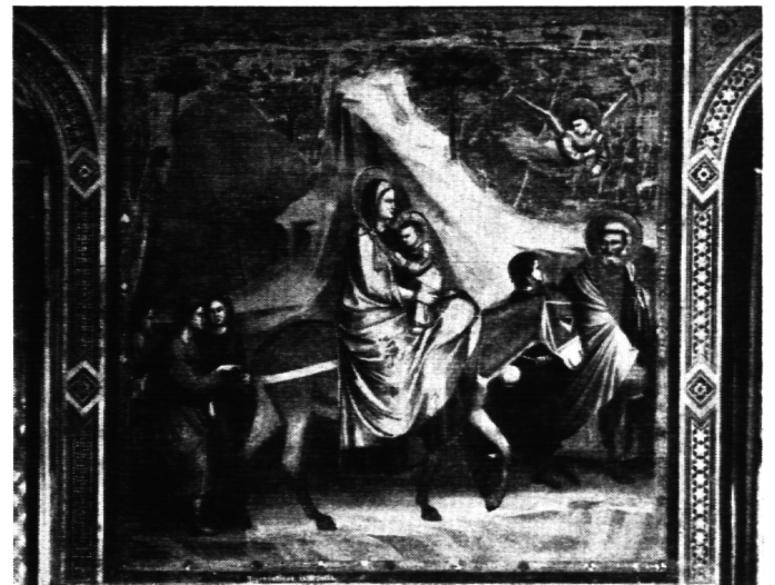
Giotto, Flucht nach Aegypten, um 1305, Padua