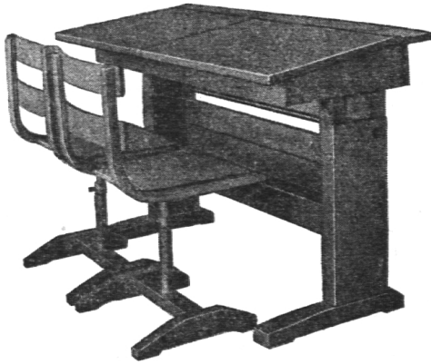
FERD. THOMA · Möbelwerkstätten Gegründet 1868 · Tel. (055) 2 15 47 · JONA/SG

berufliche Ausbildung für alle Zweige der sozialen Arbeit