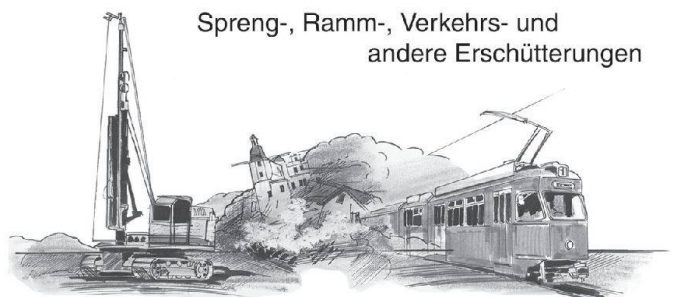
Spreng-, Ramm-, Verkehrs- und andere Erschütterungen