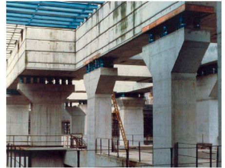
01 Federgelagertes Turbo-Generator-Maschinenfundament in Belgien, 1000 MW, Rohbau

Trombik beschäftigt sich mit elastischen Lagerungen in unterschiedlichen Arten und Anwendungen: Er entwickelt, optimiert und vertreibt eigene Federelemente für Hoch- und Höchstlasten und berät Produktionsfirmen bezüglich dynamischer Kenngrössen von Produkten und deren Qualitätssicherung. Zudem führt er schwingungsisolierende Massnahmen bei Gebäuden, Fundamenten, EDV-Anlagen oder Bienenstöcken 1 aus. Der Transfer des sich rasch entwickelnden baulastdynamikspezifischen Fachwissens in den Berufsalltag ist eines seiner Hauptanliegen. Dadurch beeinflusst er in der Schweiz den noch jungen Umweltbereich «Erschütterungen und abgestrahlter Körperschall». Nicht zuletzt hat Trombik stets ein offenes Ohr für die Anliegen junger Ingenieure und Ingenieurinnen bei ihrem Einstieg in das Gebiet der Baudynamik.