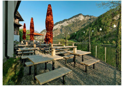
01–03 Auszeichnungen: Trainingsgerät «Funambolo», Wohnhaus in Küsnacht, Neukonzeption/Instandsetzung Insel Schwanau

In den Wäldern nimmt der Bestand an Laubbäumen zu. Der Aktionsplan Holz suchte daher in einem Wettbewerb nach gelungenen Laubholz Anwendungen in Produktgestaltung, Architektur sowie Forschung und Technik.