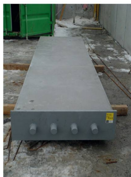
Die ausgelieferte Stütze, zur Montage bereit

Die durch das technische Büro der Elementwerk BRUN AG erstellten Pläne und statischen Nachweise wurden durch den projektierenden Ingenieur kontrolliert und freigegeben. Damit konnte durch die Produktionsleitung die Stützenarmierung und diverse Stahlteile bestellt und die termingerechte Produktion eingeplant werden.