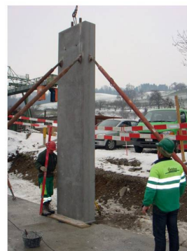
Die fertig versetzte und fixierte Stütze

Aufgrund des Stützenquerschnittes und der -gösse erfolgte die Produktion in liegenden Holzschalungen, welche von der BRUN-eigenen Schreinerei massgenau hergestellt wurde. Die diversen Einlagen erforderten von den Produktionsmitarbeitern ein exaktes Verlegen der Längsarmierung und natürlich ein millimetergenaues Montieren der Anschlussarmierungen sowie der Ankerschienen. Nach der Kontrolle der Armierung und Einlageteile erfolgte die Freigabe zum Betonieren durch den Hallenmeister.