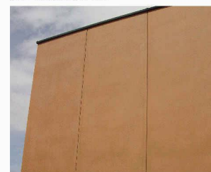
Scharfkantige Betonplatten mit schmalen Fugenbild