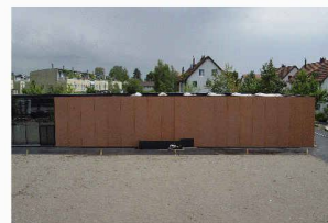
Der Kubus wächst aus dem Erdreich ...

8400 Winterthur Tel. 052 213 33 60 www.kunz-architektur.ch mail@kunz-architektur.ch