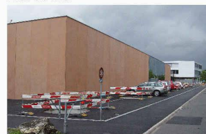
... und fügt sich in die bestehenden Gebäude ein