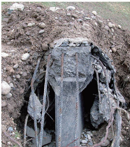
01 Die eingestürzte Decke in Gretzenbach

Schadenfälle im Bauwesen werden von der Öffentlichkeit meist nur am Rande zur Kenntnis genommen, ausser es handle sich um spektakuläre Einstürze in unmittelbarer Nähe, bei denen Personen zu Schaden kommen. Um einen solchen Fall handelte es sich beim Hallenbad Uster, in dem am 9. Mai 1985 eine untergehängte Betondecke auf das Schwimmbecken stürzte und zwölf junge Sportler tötete. Auf grosse Resonanz in den Medien stiess auch der Fall Gretzenbach, wo der plötzliche Einsturz einer Einstellhalle am 27. November 2004 zum Tod von sieben Feuerwehrleuten führte, die mit Löscharbeiten beschäftigt waren.