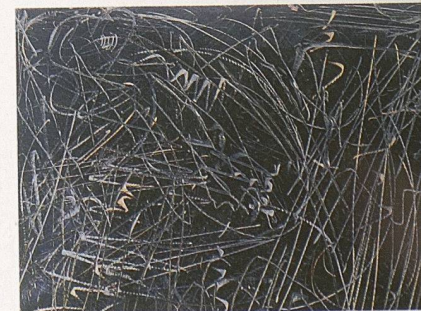
Die «Kratzspuren» – gesehen von Harald F. Müller – in Imi Knoebels «Schlachtenbild» (1990).