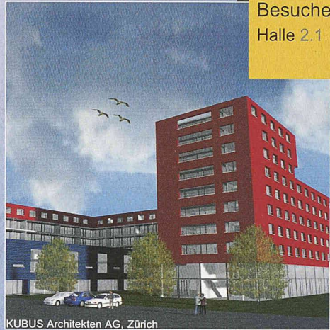
KUBUS Architekten AG, Zürich