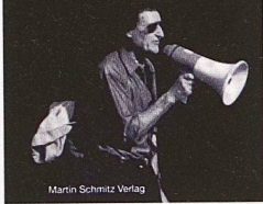
Martin Schmitz Verlag