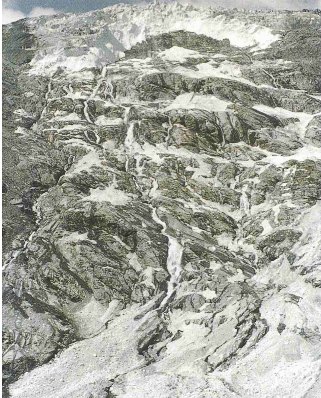
Wie warm darf die Welt noch werden? Der Allalingletscher bei Saas Almagell (VS) nach dem Gletscherabbruch am 31. Juli 2000