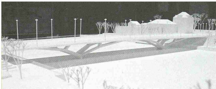
Tragstruktur, die die Kräfte bündelt und nachvollziehbar ableitet (2. Rang, Projekt Transparenz, IUB Ingenieure)