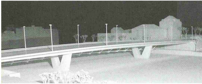
Kräftig ausformulierte Widerlager und ein robuster Balken schaffen eine Torsituation beim Übergang vom Landschaftsraum zur Stadt (1. Rang, Bänziger + Bacchetta + Fehlmann)