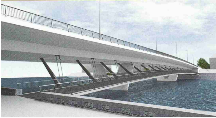
Blick unter die Hauptbrücke und auf den angehängten Fussgängersteg. Dieser verbindet die tiefer liegenden Uferwege (1. Rang, Projekt Quadral, Bänziger + Bacchetta + Fehlmann)