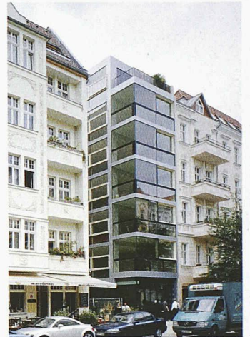
Nägeli Architekten: Wohnhaus in einer typischen Berliner Baulücke

«rein raus» von realities united, ein auf einer Stahlschiene montierter Liegestuhl, der aus dem Fenster gefahren werden kann, bietet sich als spektakulärer Balkonersatz an. Fuchs+Funke unterziehen den Klappstuhl einem Redesign und entwerfen einen «Kombinationsstuhl», einen Lounge chair, der sich in einen Sessel verwandeln lässt. Stiletto montieren innen beleuchtete Punchingbälle, die auf Anschlag reagieren, und Vogt+Weizenegger lassen ihren «Sinterchair» von einer Modellbaumaschine aus Nylonpulver herstellen. Ironie ist ein Merkmal der unter «Konzepte» laufenden Entwürfe. Rafael Horzon etwa schlägt eine Verschalung vor, mit der unliebsame oder missglückte Fassaden «getarnt» werden können. Marion Eichmann «verstrickt» sich in der Entfremdung. In ihrer Arbeit «16.324.800 Maschen» umstrickt sie Wand, Boden, Tisch, Stuhl, Vase, Tasse und sich selber mit einem einheitlichen schwarzweissen Wellenmuster, in dem die einzelnen Gegenstände miteinander verschmelzen. Konkreter mit der Stadt befassen sich realities united und F.r.e.d. Rubin. Erstere thematisieren den städtebaulichen Aspekt, sie wollen den brach liegenden Flussraum mit einem