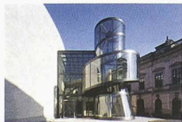
Der gläserne Treppenturm des Deutschen Historischen Museums von Ieoh Ming Pei (Bild: DHM)

Das Historische Museum, das Anfang der 90er-Jahre nach einem siegreichen Wettbewerbsprojekt von Aldo Rossi im Spreebogen hätte errichtet werden sollen, residiert heute im ehemaligen DDR-Museum für deutsche Geschichte im einstigen Zeughaus am Boulevard Unter den Linden. Da der Barockbau von Andreas Schlüter mit der Sammlung ausgelastet ist, wurde der Anbau hinter dem Zeughaus für Wechselausstellungen geplant. Dieser ist unterirdisch mit dem Altbau verbunden. Oberirdisch markiert er seine Präsenz mit dem gläsernen, spindelförmigen, skulptural ausgebildeten, Treppenturm – Blickfang und Verweis auf das ausgedehnte Erschliessungssystem im Innern, das als Entdeckungsreise angelegt ist. Ieoh Ming Pei baute weltweit zahlreiche Museen. Sein bekanntestes ist die Erweiterung des Louvre in Paris (1988–93) und insbesondere dessen Glaspypamide. Sein vom landschaftlichen Kontext her vielleicht Spektakulärstes ist das Miho Museum im gebirgigen Naturreservat der Stadt Shigaraki in Japan.