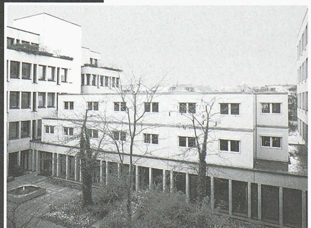
2-geschossiger Aufbau auf bestehendes Flachdach

Scheifele Container AG • Vorfabrizierte Bauten Unterdorfstrasse 21 • 8114 Dänikon Tel. 01 844 34 40 • Fax 01 844 34 74 container@scheifele.com • www.scheifele.com ISO 9001:2000 zertifiziert