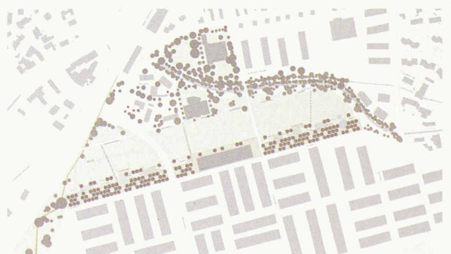
Im Süden die Promenade, in der Mitte die Wiese, im Norden der Naturraum um die Eulach (2. Rang, Heipl & Staubach)