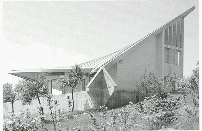
Das Haus Antoinette Vischer, 1961, Hegenheim (F), von Felix Schwarz und Rolf Gutmann, mit hyperbolischem Paraboloiddach; unten ihr Stadttheater Basel von 1969–75 (Bilder: Schwarz und Gutmann)